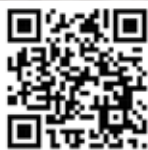
Video uradak iz performansa "Revolucija" u QR modelu