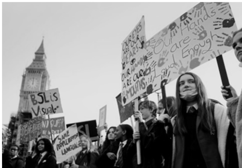
Skup je održan na Parlamentarnom trgu

“Mislim da je ovo odavno trebao biti zakon”, rekla je.