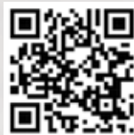
Dio predstave "Ruke koje plaču" 2006. godine u QR modelu