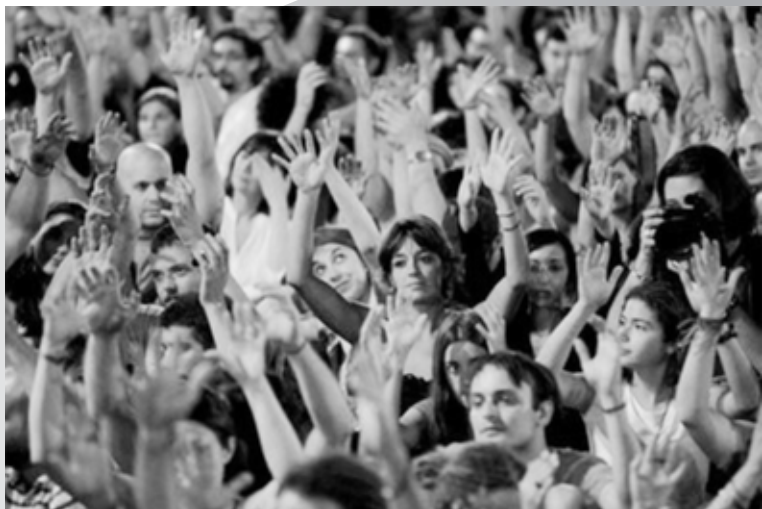
Tihi pljesak na Puerta del Solu

Godine 2011. u Španjolskoj se dogodio društveni pokret s važnim utjecajem na nacionalnoj i međunarodnoj razini. Bio je poznat kao Pokret 15-M, koji je proizašao uglavnom iz nezadovoljstva dijela stanovništva političkim autoritetom. Pa onda, jedan od doprinosa koji su Gluhi ljudi i znakovni jezik dali ovom društvenom pokretu bio je ono što se nazvalo 'tihim pljesakom', tipičan za zajednicu gluhih, koji se sastoji od mlataranja rukama po zraku, tražeći vizualni učinak sličan uz zvučni pljesak.