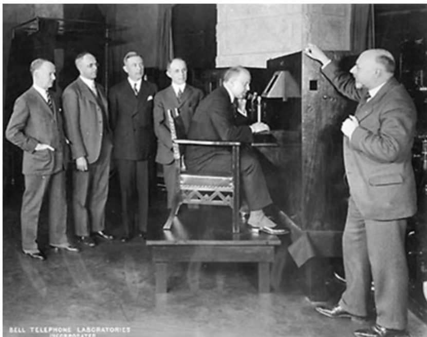
Videofon iz 1927

Na jesenskom forumu IMTC 2008 , održano je predavanje na temu: “ Prošlost, sadašnjost i budućnost video telekomunikacija ”