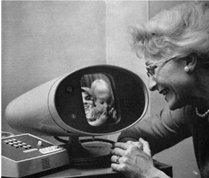
1964 slikovni telefon

Nedavno su sustavi "telepresence" ( Cisco , HP , Polycom , Tandberg ) napravili korak u tom smjeru. Ovi sustavi su bolji, ali još uvijek daleko od onoga što je potrebno. Također su nevjerojatno skupi za potrošačku upotrebu.