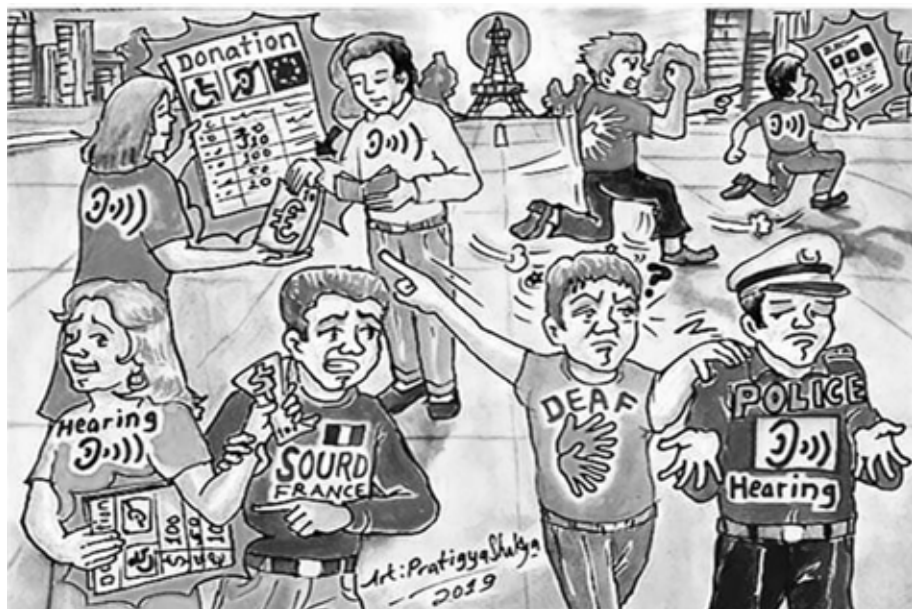
Illustrator: Pratigya Shakya