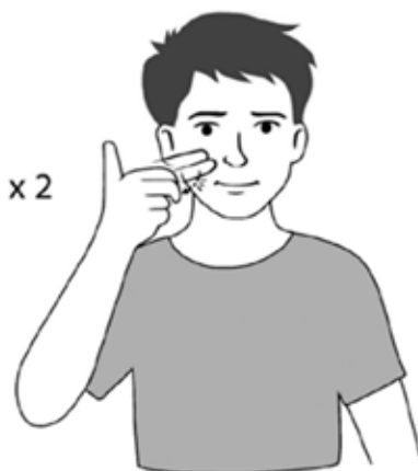
Znak Laurent Clerc

Jedan od najboljih dojmova koje je Clerc ostavio u povijesti znakovnog jezika je da se 58% američkog znakovnog jezika može pripisati njegovim učenjima. Laurent Clerc rođen je u malom selu, La Balme Grottes u blizini Lyona u Francuskoj 26. prosinca 1785. Rođen je s sluhom, no kad je imao godinu dana, upao je u vatru. Zbog toga je izgubio i sluh i njuh. Desna strana lica bila mu je jako opečena i ostao je s ožiljcima za cijeli život. Međutim, u kasnijim godinama, ožiljci su ga samo činili još istaknutijim. Znak za njegovo ime temeljio se čak i na ožiljku.