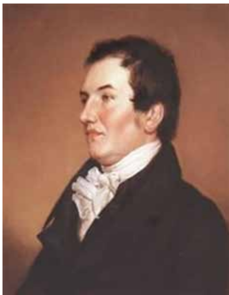
1822. Laurent Clerc, 37. god

tivni gluhi građani i obrazovani gluhi vođe, šireći njegova učenja i čineći Clerca najvećim poticateljem osnivanja novih škola za gluhe u Sjedinjenim Državama u to vrijeme. Clercovi učenici i obučeni učitelji osnovali su druge škole diljem zemlje, koristeći Clercove metode podučavanja. Sve u svemu, više od trideset rezidencijalnih škola osnovano je diljem zemlje tijekom Clercova života.