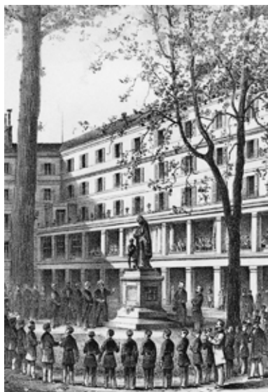
Obavanje počasti Abbéa de l'Épée ispred njegovog spomenika

Tijekom godina, Institut je proširio svoj doseg, primajući studente iz različitih sredina i regija. Postao je središte za razmjenu ideja, poticanje obrazovnih inovacija i obuku nastavnika u specijaliziranim metodama obrazovanja gluhih učenika. Naime, utjecaj Instituta proširio se izvan Francuske. Pedagozi i reformatori iz različitih zemalja posjetili su Institut kako bi proučavali metode Abbéa de l'Épéea, nadahnjujući osnivanje sličnih škola za gluhe širom svijeta.