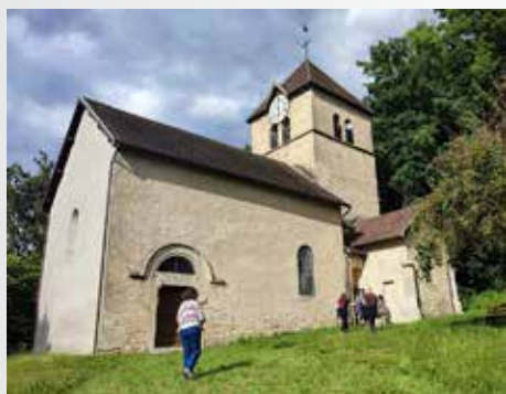
Crkva Saint Pierre