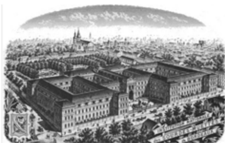
Institut National de Jeune Sourds-Mirets u Parizu

Godine 1797., kada je Laurent imao dvanaest godina, njegov ujak po kojem je dobio ime, Laurent Clerc, upisao ga je u Institut National de Jeune Sourds-Mirets u Parizu. Bila je to prva javna škola za gluhe u svijetu. Školu je pokrenuo svećenik po imenu Abbe De L'Epee. Ova je škola postala uzor stotinama drugih škola koje će se kasnije osnovati. Školom je upravljao Abbe Rock-Ambroise Sicard. Laurentov prvi učitelj, Jean Massieu, imao je 25 godina i bio je gluh poput njega. Massieu mu je postao mentor i doživotni prijatelj.