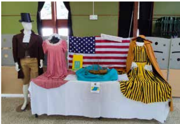
Izložba odjevnih predmeta iz Clercova vremena