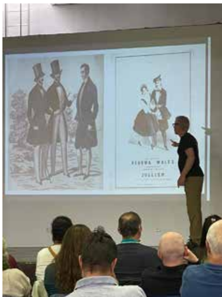
Na konferenciji predavanje drži potomak Laurenta Clerca. Tema: "Laurent Clerc u Americi"