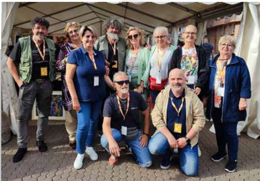
Gluhi likovni umjetnici na Festivalu

Dodao je i da je svjestan da ima još puno prostora da se poboljša mobilnost osoba s invaliditetom u Zagrebu te da razgovara s udrugama o mogućim rješenjima. Istaknuo je također da je u planu sve tram-