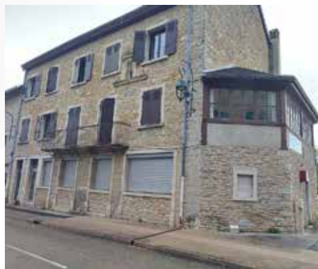
Rodna kuća Laurenta Clerca