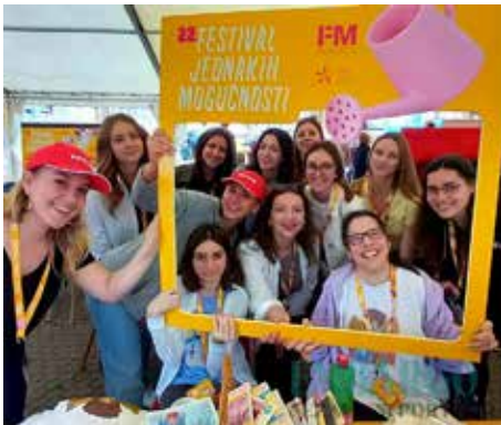
Grupa volontera na Festivalu

Organizaciju festivala pomaže 20 stručnjaka i oko 100 volontera. Volonteri tijekom Festivala usvajaju socijalni pristup osobama s invaliditetom, te ga primjenjuju u svojem profesionalnom i društvenom radu.